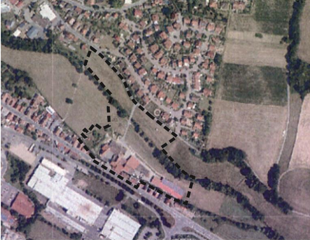
Abb. 2: Luftbild des Planungsstandortes einschließlich Umgebung